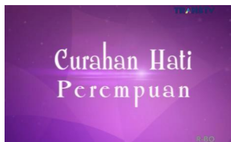
Gambar 5. Judul Program