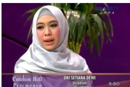
Gambar 4. Pakar Agama Islam Oki Setiana Dewi