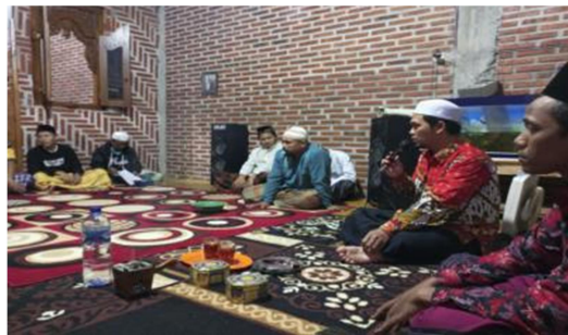
Gambar 2. Menggali pemahaman Dasar Peserta Kegiatan

Pada kesempatan ini mitra pengabdian hanya diminta untuk mengisi pretest yang bertujuan untuk mengetahui pemahaman moderasi agama mereka sebelum diadakannya pelatihan. Acara berjalan dengan lancar dan semua peserta mengisi formulir yang disediakan tepat waktu.